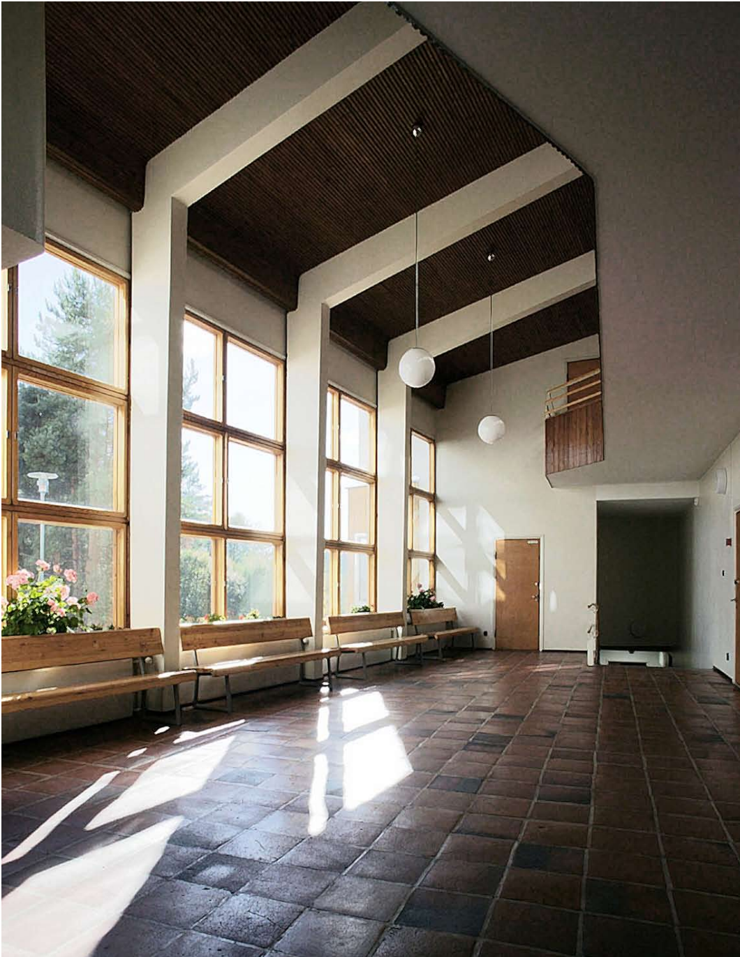
AULA JA RUOKALA VUONNA 2003.