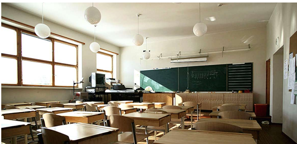
LUOKKAHUONE KUNNOSTUSTÖIDEN JÄLKEEN VUONNA 2003.

Koulurakennuksen kokonaisala on 1780 b-m 2 ja vuonna 2002 rakennetun lämpökeskuksen 55 b-m 2 .