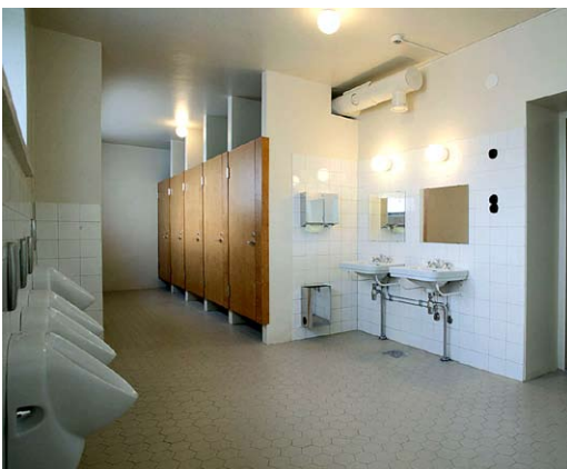
KUNNOSTETTUA WC-TILOJA VUONNA 2003.