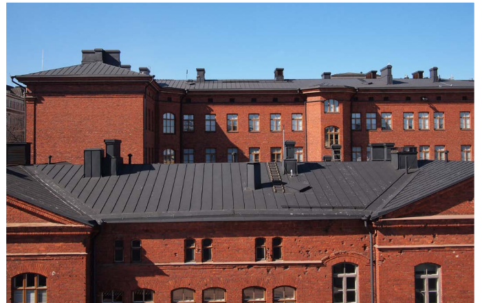
YLLÄ KAARTIN KASARMIN TOIMISTOSIIPI JA ALLA 1800-LUVUN LOPUN PUNATIILIRAKENNUKSET KUVATTUNA VUONNA 2016.