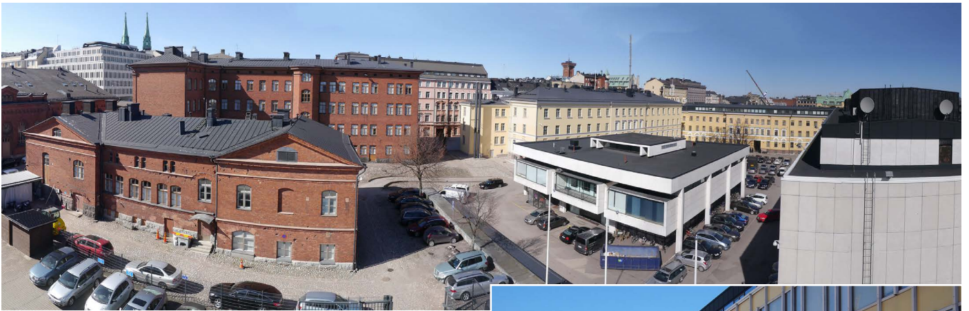
KAARTIN KASARMIKORTTELI KEVÄÄLLÄ 2016.