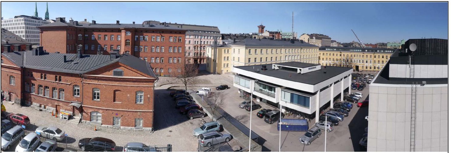
KAARTIN KASARMIKORTTELI KEVÄLLÄ 2016.