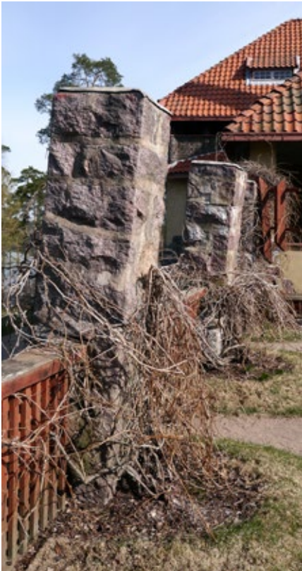
↓ Eteläterassin pilarit ennen kunnostusta. amoy 2014