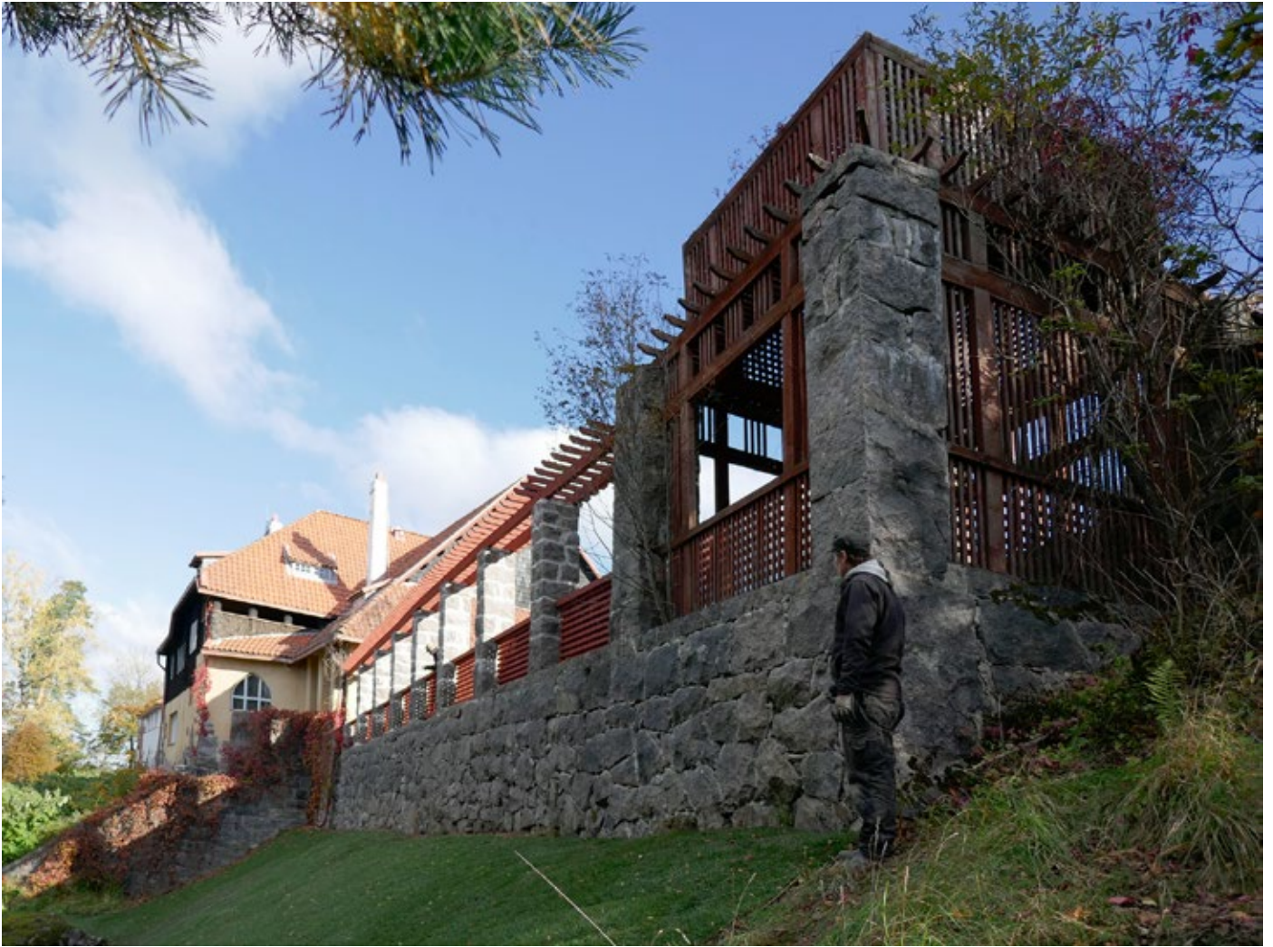
↑ Eteläterassin läntinen tukimuuri alarinteen puolelta korjauksen jälkeen. amoy 2016