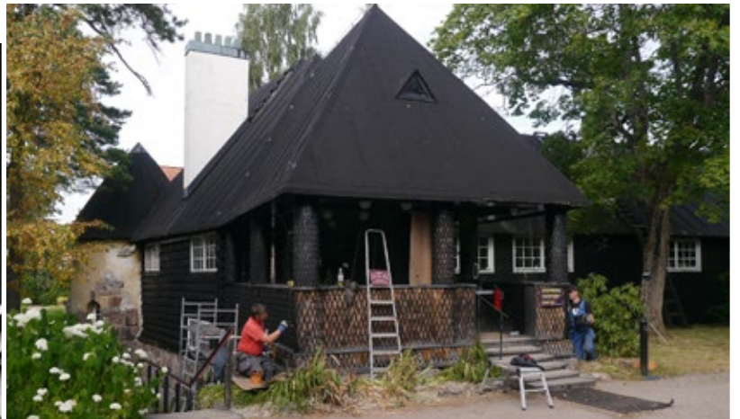
↑ Piharakennuksen verannan tervaus.

Kunnostus- ja tervauustyöt vuosina 2014-18 suoritti Uudenkaarlepyyn Rakennus ja paanukatto Oy yhdessä Rakennuspalvelu Kim Isakson Oy:n kanssa.