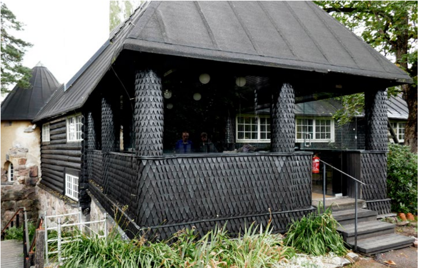
↑↓ Piharakennuksen julkisivuja tervauskunnostuksen jälkeen. amoy 2016