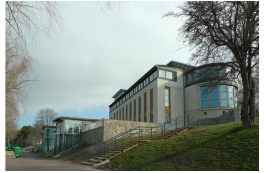
ÅLANDS SJÖFARTSMUSEUMIN VANHA OSA JA UUSI LAAJENNUS RANNAN PUOLELTA KEVÄÄLLÄ 2012.

VASEMMALLA VANHAA OSAN JULKISIVUJA KUNNOSTUKSEN JÄLKEEN.