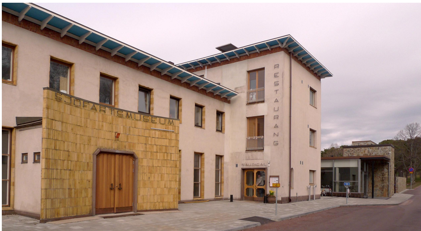
ÅLANDS SJÖFARTSMUSEUMIN VANHA OSA JA UUSI LAAJENNUS KADUN PUOLELTA KEVÄÄLLÄ 2012.