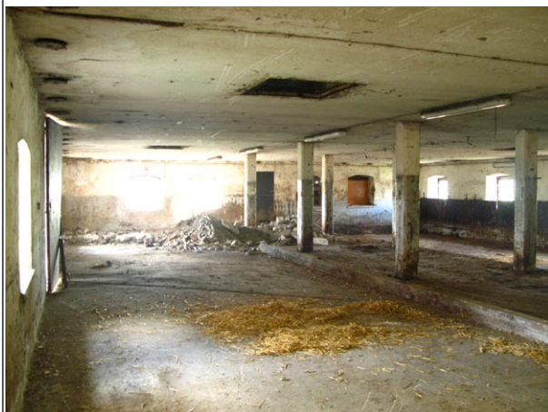
NAVETTA ENNEN MUUTOSTÖITÄ.