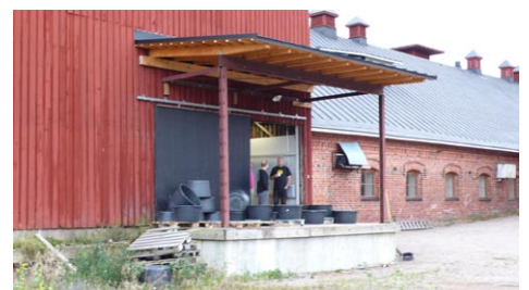
UUSI LASTAUSLAITURI JA KATOS.

MALMGÄRDIN PANIMO (1890-luku) Koskenkylä, Malmgårdin panimo oy