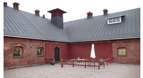
VANHAN MAITOLAN PAIKALLE RAKENNETAAN KAHVILAN / RAVINTOLAN TERRASSI KESÄLLÄ 2013.