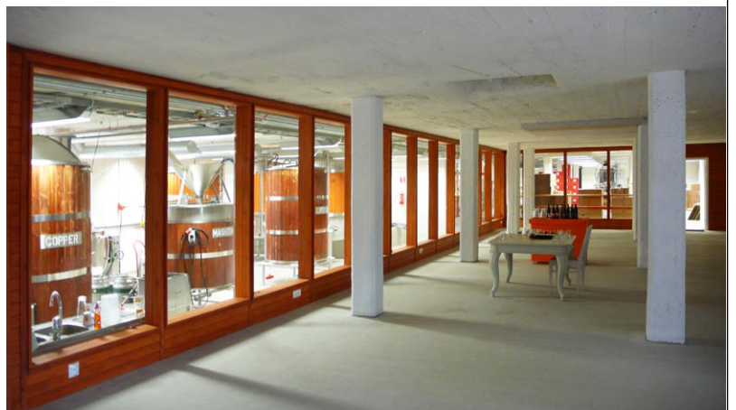
NÄKYMÄ RAVINTOLASALISTA PANIMOON MUUTOSTÖIDEN JÄLKEEN.

MALMGÅRDIN PANIMO (1890-luku) Koskenkylä, Malmgårdin panimo oy