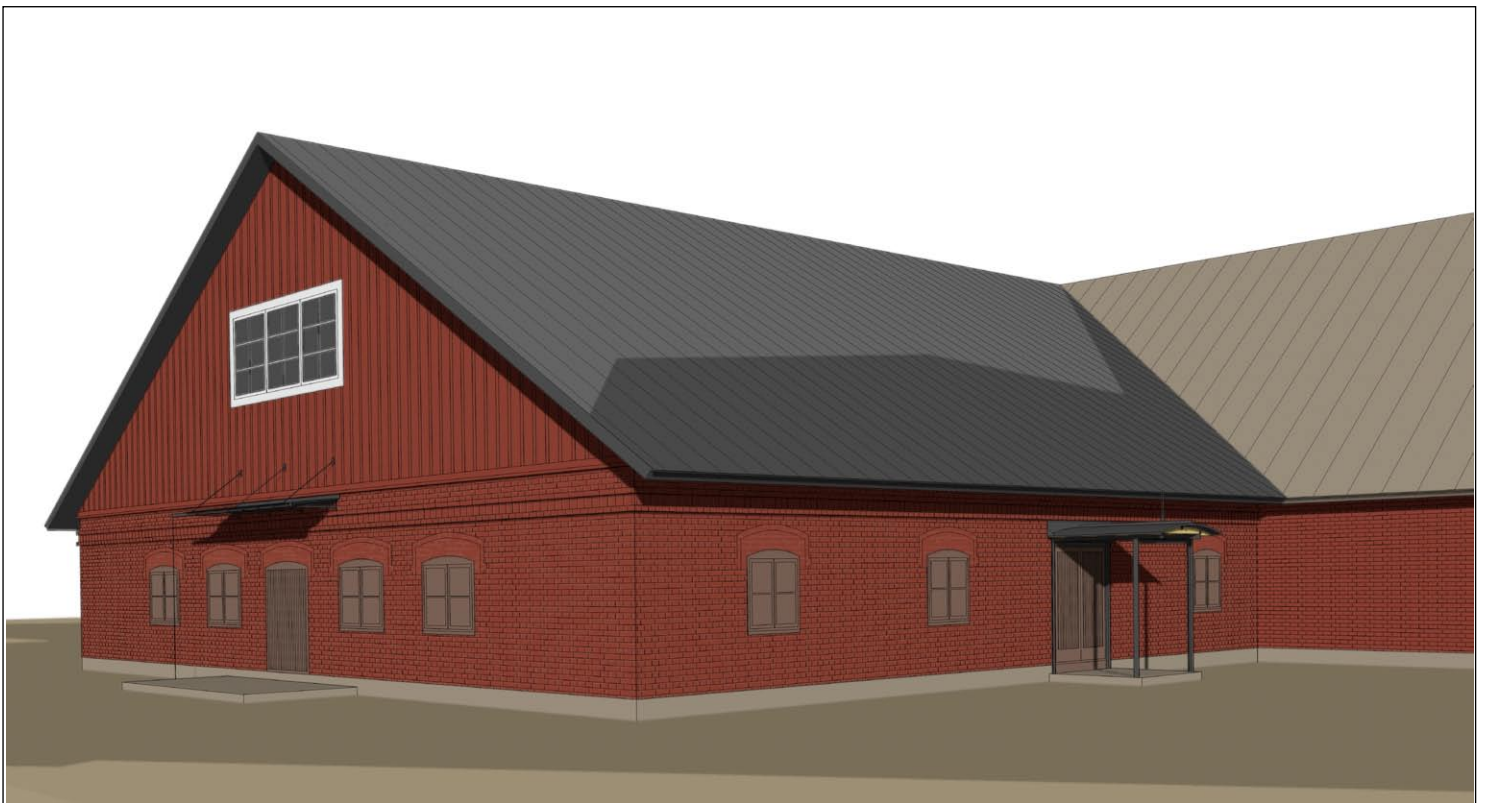
HAVAINNEKUVA MYYMÄLÄN SISÄÄNKÄYNTIKATOKSISTA.