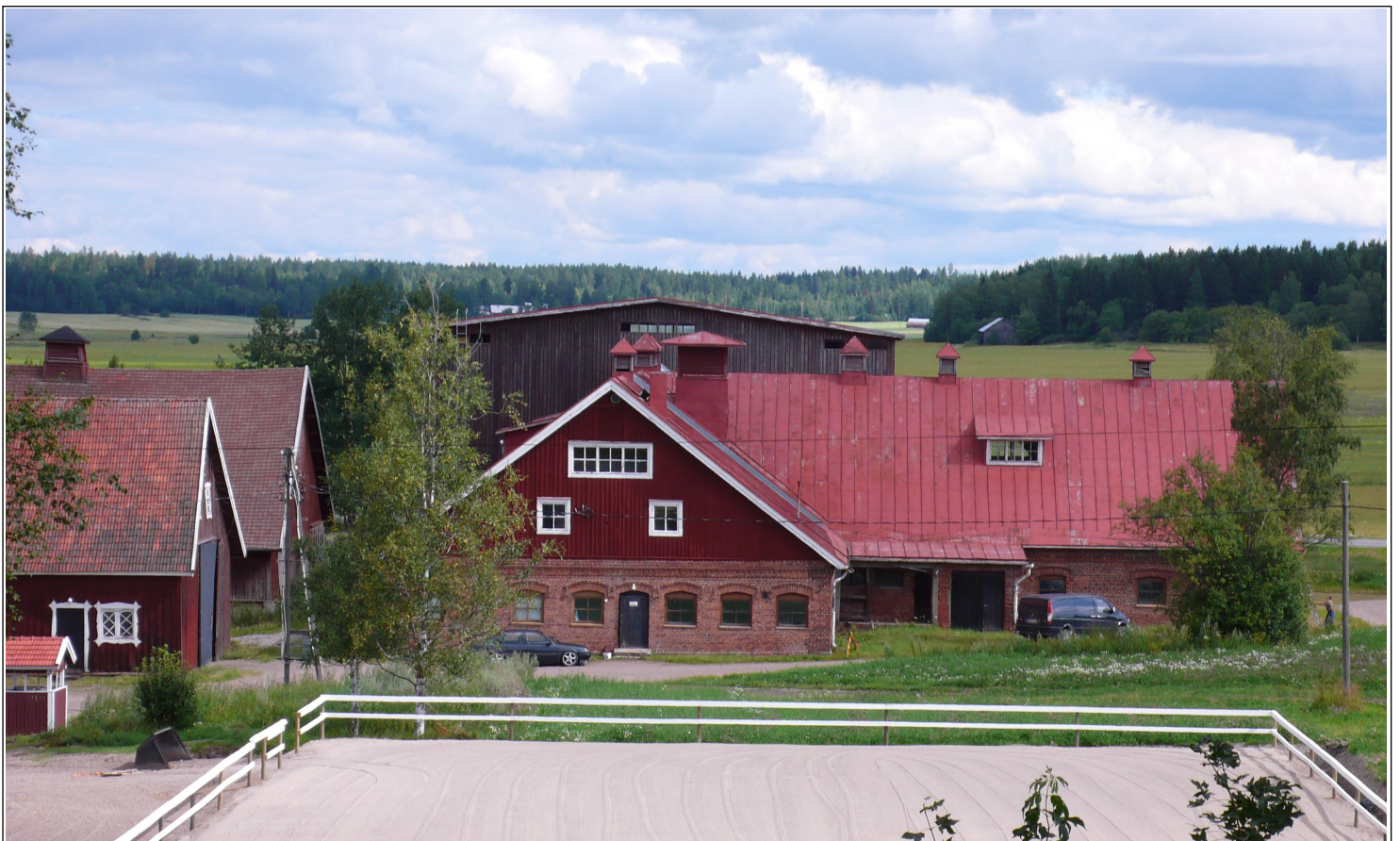
MALMGÄRDIN NAVETTARAKENNUS ENNEN MUUTOSTÖITÄ.