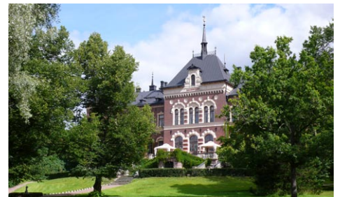
MALMGÄRDIN KARTANON PÄÄRAKENNUS